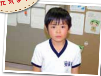
広報とばに掲載された写真を差し上げます。 ご希望のかたは、総務課広報情報係まで。