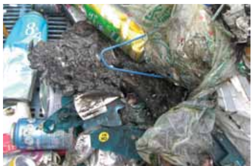
ライターとスプレー缶の混在が原因とみられる火災

今回は幸いにも大事には至りませんでした。一歩間違えば大惨事に発展する可能性がありますので、ライターは使いきったあと「不燃ごみ」の日に、スプレー缶は中身を使い切って穴を開けたあと「リサイクルごみ」の日に指定のごみ集積所にしてください。