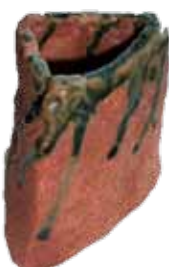
昨年度受講者の作品(花器)