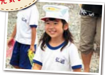
広報とばに掲載された写真を差し上げます。 ご希望のかたは、総務課広報情報係まで。