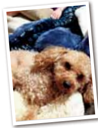
竹内マロン オス8歳