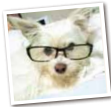
山本ラン メス 11歳