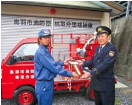
桃取分団格納庫で行われた寄贈式

寄贈された軽消防自動車は、島の狭い路地にも進入しやすく、火災予防の啓発や消火活動など、島民の安全・安心のために活用されます。