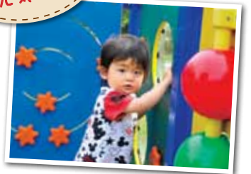
広報とばに掲載された写真を差し上げます。 ご希望のかたは、総務課広報情報係まで。