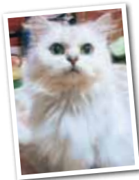
スノーベル メス10歳