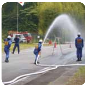
昨年の操法大会の様子