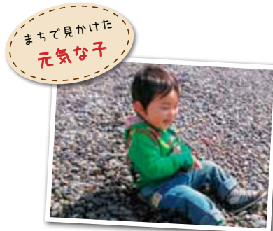
広報とばに掲載された写真を差し上げます。ご希望のかたは、総務課広報情報係まで。