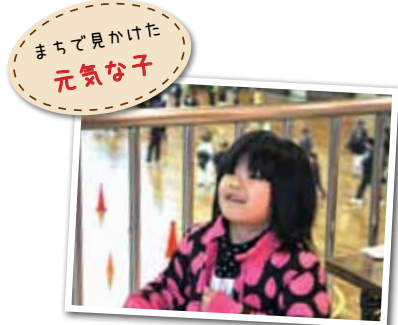
広報とばに掲載された写真を差し上げます。ご希望のかたは、総務課広報情報係まで。