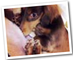
玉置キビ メス 10か月