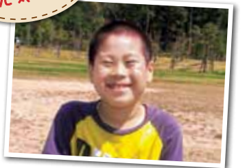
広報とばに掲載された写真を差し上げます。 ご希望のかたは、総務課広報情報係まで。