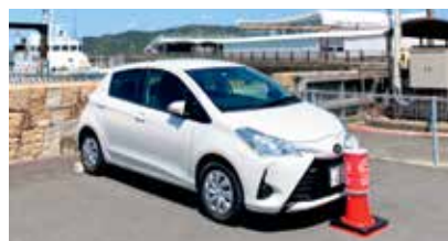
1月から車両に抗菌処理をしています