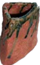
昨年度受講者の作品(花器)