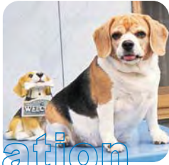
奥水いちご(メス 6歳)