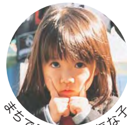
※ちびで見た元気な元氣な