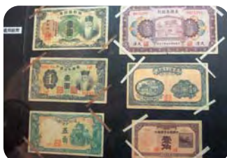
明治から大正時代に収集された外国紙幣