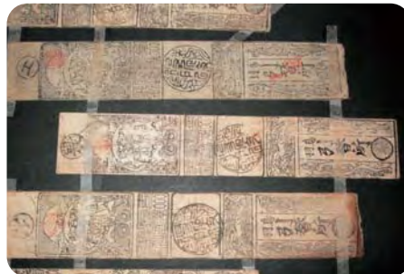
鳥羽藩が発行した藩札

※これらの古銭は、1月4日(金)から市歴史文化ガイドセンターで展示されます。(くわしくは17ページに掲載)