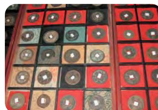
一文銭のコレクション