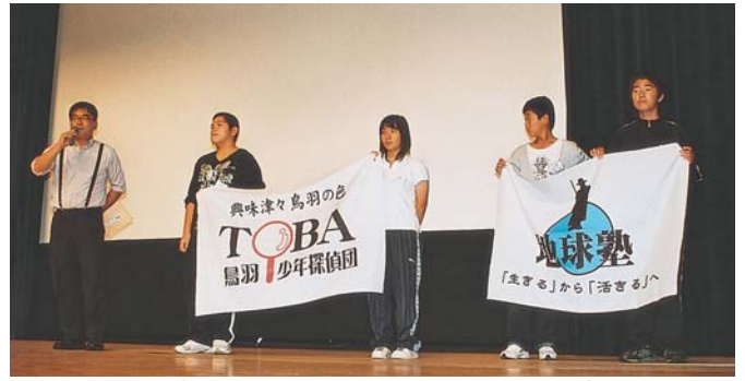
第2回学習会では、潮騒フェスティバルに出演しました