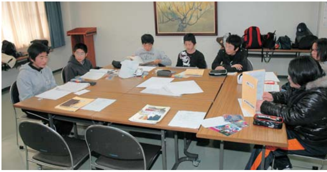
第3回学習会では、今まで調査した内容をまとめました