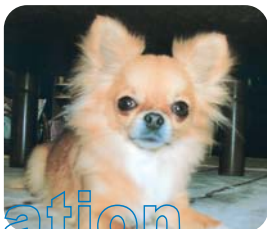
北村マロン(メス 2歳)