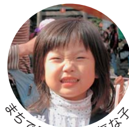
先ちで見かけた元気な子

広報とばに掲載された 写真を差し上げます。 ご希望のかたは、総務 課秘書広報係まで。