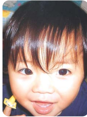
ご飯大好き♡ わんぱく次男坊☺