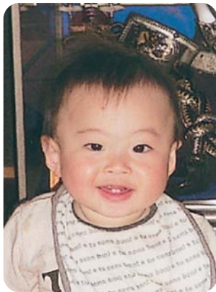
元気いっぱい!! ニコニコスマイル ひらくです♪