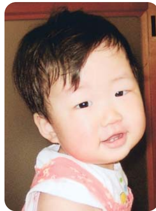
動くの大好き! ただ今、歩く練習中♡