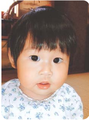
お散歩、だーいすき!!