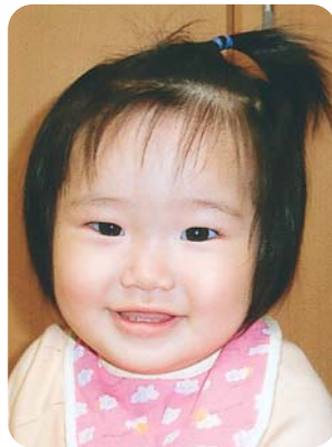
元気いっぱいの おてんば娘です。