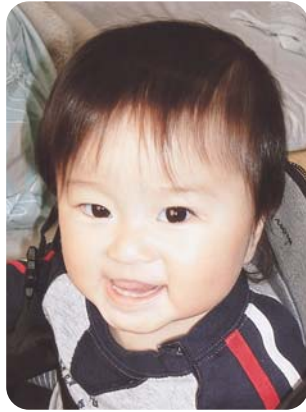
ケンカもよくするけど 兄ちゃん大好き☺