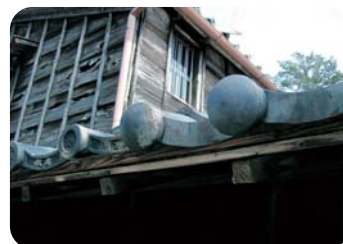
マンジューといわれる昭和の瓦

江戸時代には「大庄屋」も務め、鳥羽随一の資産家といわれた広野家。平成16年に市に寄贈された広野邸から、さまざまな鳥羽の昔の姿が見えてきます。