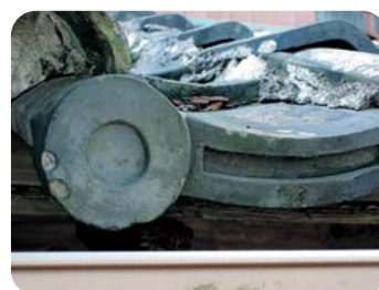
大正期の輪切りタイプの瓦