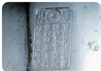
刻銘の刻まれた古い瓦