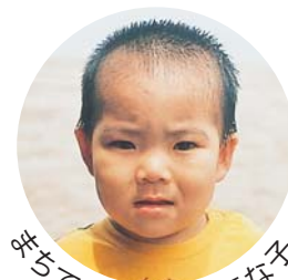
写真で見かけた元気な子

広報とばに掲載された 写真を差し上げます。 ご希望のかたは、総務 課秘書広報係まで。