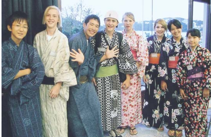
みんなで浴衣を着ました