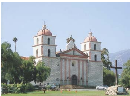
歴史のある建物、オールドミッション教会

かたがたと、お世話になったたくさんのかたがたに心から感謝の気持ちを伝えたいです。本当にありがとうございます。