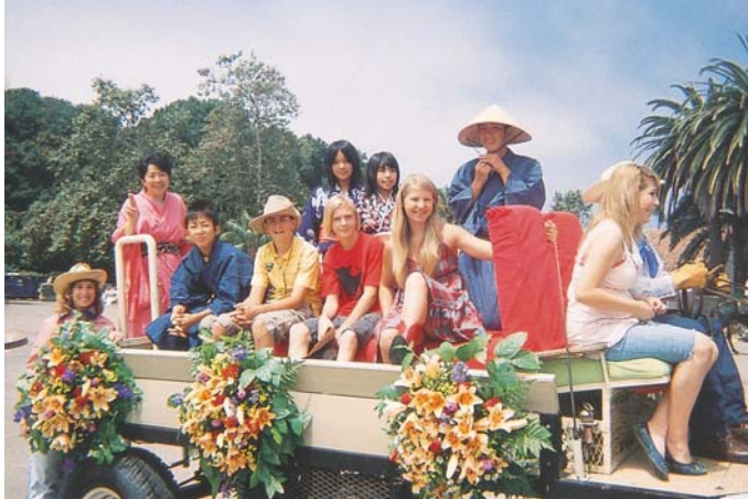
浴衣姿でサンタバーバラの祭り「フィエスタ」のパレードに参加