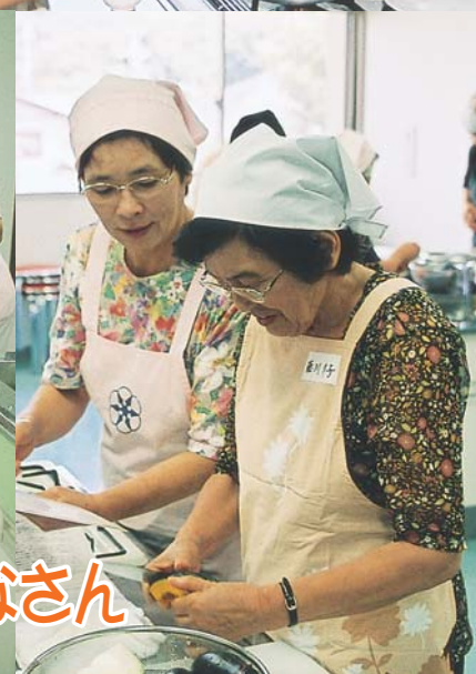
鳥羽市食生活改善推進連絡協議会のみなさん 《食生活における健康づくり推進活動》