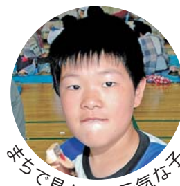
元気が子で見た見ち