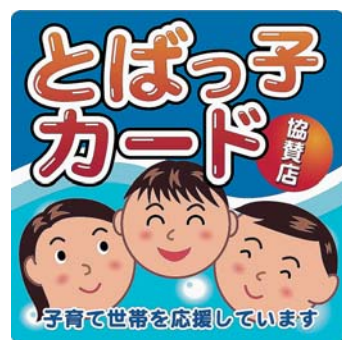
このステッカーが目印です