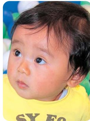
まいにちのおさんぽタ～イスキ☆ いつもニコニコいい笑顔だよ♡