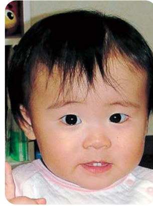
1歳おめでとう♡ これからも元気に育ってネ