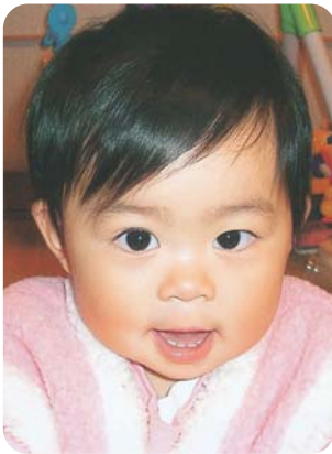
くいしんぼうの桃ちゃんです♡ よろしくね♡