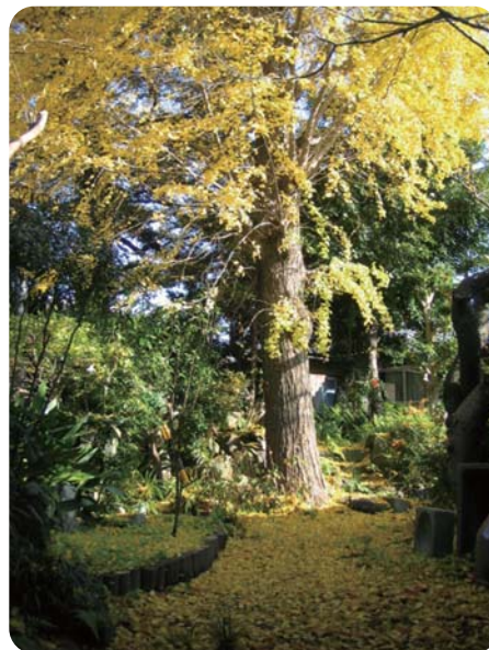
広野家のイチヨウ庭は、まるで黄金のじゅうたんを敷き詰めたかのようになります

広野家の屋敷内には、モミの木と並んでイチヨウの原木があります。明治22年に刷られた広野家を描いた版画(上図)には見受けられないことから、それ以降に植えられたものと考えられます。樹齢およそ70〜80年、樹高は約25mで、近隣のどこから見ても見えるほどひとときわ高く目立っています。 イチヨウの木は、毎年11月末に美しく色づくので、その時期に合わせて昨年11月22日に一般公開を行いました。見学に訪れた約150人のかたたちに、庭一面に敷き詰められた黄金のじゅうたんを眺めながら穏やかな秋を味わっていただき、収穫したばかりのギンナン20kgをお土産として振る舞いました。