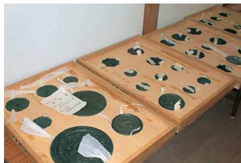
古墳時代の鏡など、100点もの貴重な神宝が保管されています

みなさんは神島の八代神社 にある神宝をご存じでしょ うか。 一般に公開されていないの で、知らないかたも多いかも しれませんが、実は、この神 社の宝物殿には、たくさんの 神宝が保管されています。 内容は、今から1,500年 前の古墳時代の鏡や太刀、奈 良から鎌倉時代にかけての 鏡、金銅製の機織具、陶器と いった土器など多様で、なん と100点もあります。