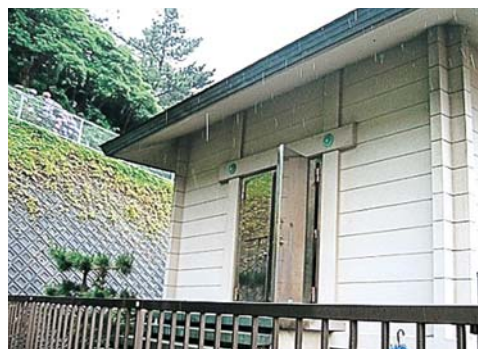
八代神社の宝物殿

一般に公開されていないの で、知らないかたも多いかも しれませんが、実は、この神 社の宝物殿には、たくさんの 神宝が保管されています。 内容は、今から1,500年 前の古墳時代の鏡や太刀、奈 良から鎌倉時代にかけての 鏡、金銅製の機織具、陶器と いった土器など多様で、なん と100点もあります。