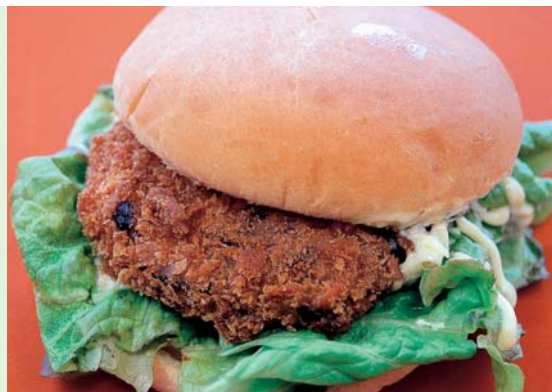
とばーがー第2弾の伊勢海老バーガー

「とばーがー」とは、地元食材を手軽に食べてもらうと同時に、テイクアウトグルメとして、鳥羽の「食」と「ロケーション」を楽しんでもらいたい、鳥羽のイメージ向上と活性化を目的にスタートした創作ハンバーガーです。