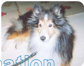
下村ポッチー(オス・15歳)