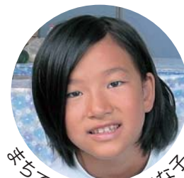
笑ちで見かけた元気な子

広報とばに掲載された 写真を差し上げます。 ご希望のかたは、総務 課広報情報係まで。