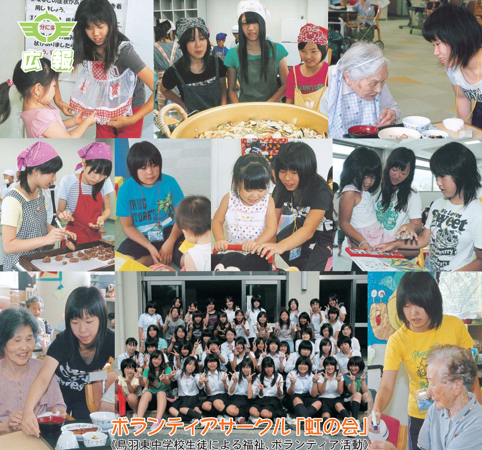
ボランティアサークル「虹の会」 《鳥羽東中学校生徒による福祉、ボランティア活動》