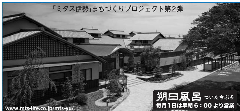
「ミタス伊勢」まちづくりプロジェクト第2弾