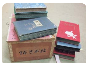
約500点もの絵はがきをとじたアルバム10冊が入っていました