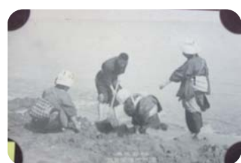
明治の阿漕海岸での貝採り風景