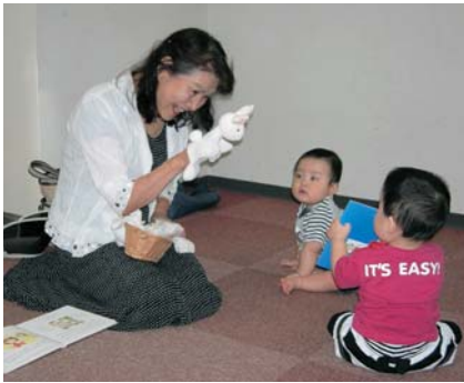
赤ちゃんが対象の「赤ちゃん絵本の会」

複しているものや保管期限の過ぎた雑誌などを廃品回収に回さず、市民のみなさんに無料でもらっていただいています。日時などは、広報とばや館内のポスターなどでお知らせしています。