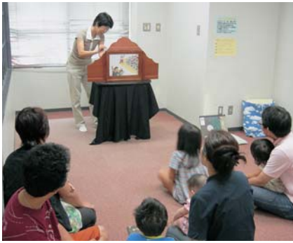
「絵本と紙芝居の会」は、毎月2回開催

また、依頼のあった保育所や幼稚園、小中学校に出向いています。ご希望があれば図書館へご連絡ください。