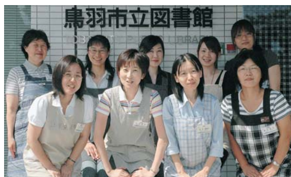
わたしたちがお話しします