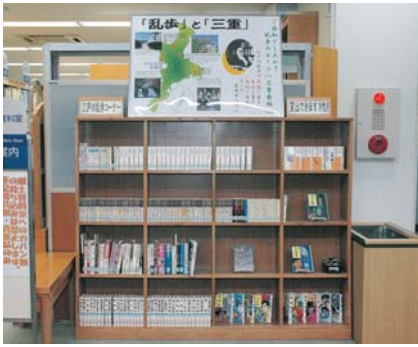
今年度新設された「江戸川乱歩コーナー」