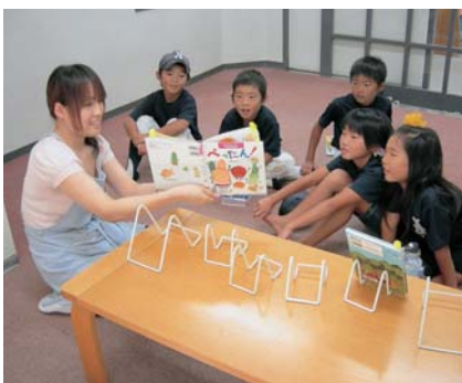
本の楽しさを紹介する「ブックトーク」

これらのさまざまな行事や取り組みは、「広報とば」毎月1日号でその内容をお知らせしています。くわしく知りたい場合は、図書館へ問い合わせてください。