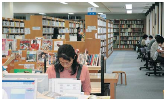
約18万冊の本があります

体の不自由な方に、できる限り身近なところで利用いただくため、市内の連絡所で貸出・返却サービスを行っています。