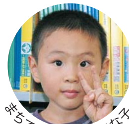
元気がみなぎって見かけた赤ちゃん