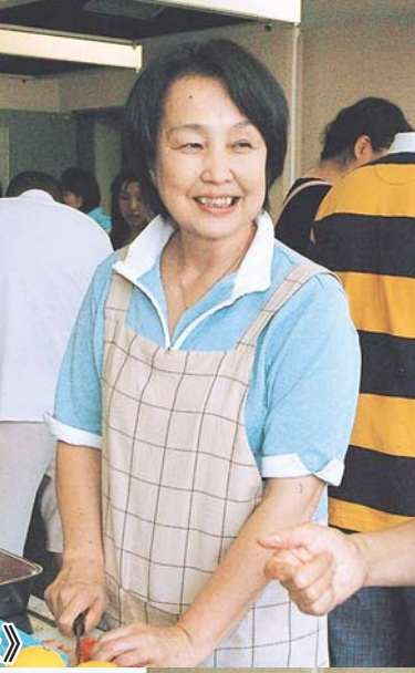
鳥羽国際交流ボランティアの会 《異文化交流や日本語教室、レクリエーションの開催》