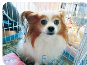
井面チップ(オス 12歳)