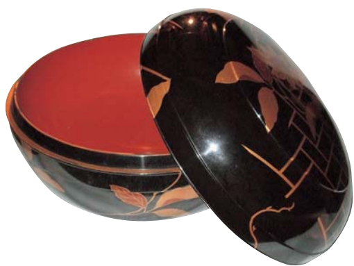
黒の漆塗りに鮮やかな金色の花の柄が映える、大変貴重なこね鉢

蔭絵のこね鉢 広野家の内蔵には、薬屋を営んでいたころの道具が完全な形で残っています。 広野家は、大阪や名古屋から取り寄せた薬を販売するだけでなく、広野家独自の薬も製造しており、薬研（やげん）で薬材を粉にし、それを練る立派なこね鉢が2点残っています。 こね鉢は、ちょうどそば粉を練る鉢に似ていて、直径40cm、高さ32cmほどで、黒の漆塗りに金色の花が図柄として蔭絵されています。収納されている入れ物も漆塗りされていて、貴重な品だったことがうかがわれます。