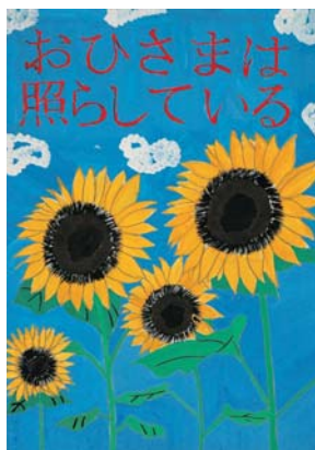
山下 琴巳 (答志中3)