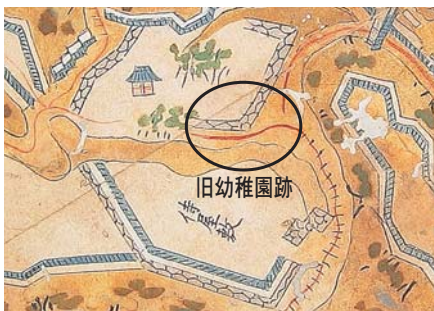
鳥羽城絵図(図書館蔵)の中の丸で囲んだ部分が確認されました

石垣は、乱積みで、旧鳥羽小学校運動場や、旧幼稚園跡の石垣と同様の積み方になっています。角部には、算木積(さんぎづみ)と呼ばれる手法