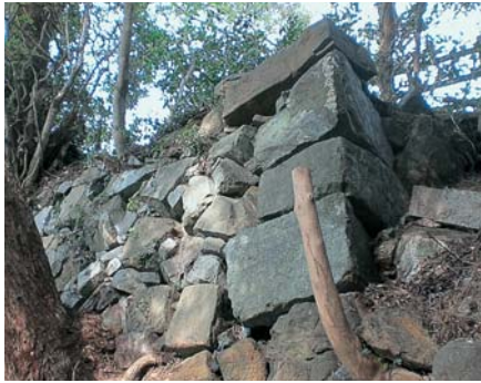
台風 18 号の通過によって姿を現した石垣

10月の台風18号は、市内各地に大きな被害をもたらしました。鳥羽城跡でも、木がたかさん倒れたり、一部の石垣が崩