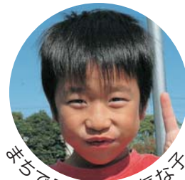
平気で見かけた元気な子