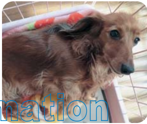
井面 レナ(メス 6歳)