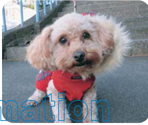
山本 花(メス 2歳)