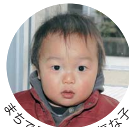
半ちで見かけた元気な女