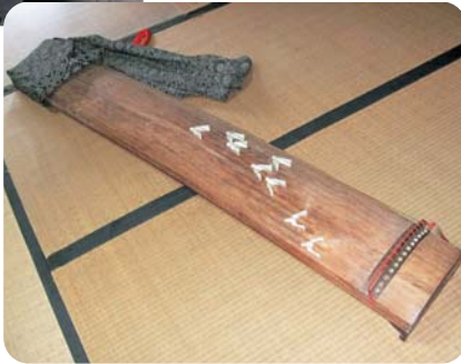
琴（弦は13本。左手で弦を押さえ、右手で弾きます）