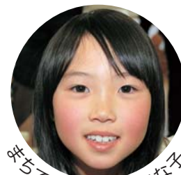
元気で見た元気な子

広報とばに掲載された 写真を差し上げます。 ご希望のかたは、総務 課広報情報係まで。