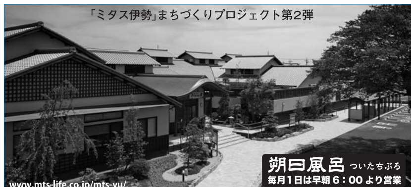
「ミタス伊勢」まちづくりプロジェクト第2弾