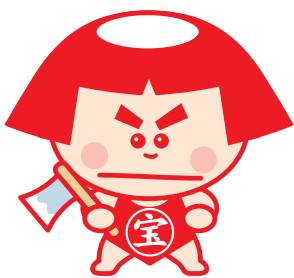
このマークは宝くじ助成事業で助成をいただいた備品についています。

今回、助成をいただいた備品を有効活用し、コミュニティ活動の発展を図っていきます。