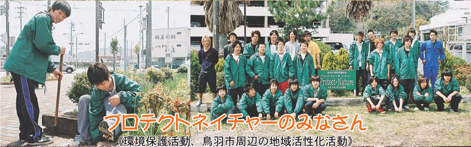
プロテクトネイチャーのみなさん 《環境保護活動、鳥羽市周辺の地域活性化活動》