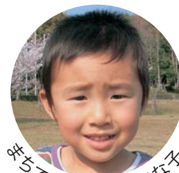
写真で見かけた元気な子

広報とばに掲載された 写真を差し上げます。 ご希望のかたは、総務 課広報情報係まで。