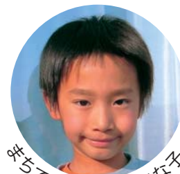
早ちで見かけた元気な子

広報とばに掲載された 写真を差し上げます。 ご希望のかたは、総務 課広報情報係まで。