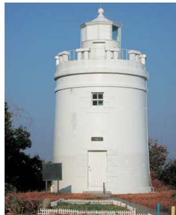
イギリスの技師プラントンの指導により建てられました。灯台横にあった職員官舎は明治村に移築されています。

平成21年1月1日号の「広報とば」でも紹介しましたが、菅島灯台は明治6年に建造された灯台で、日本最古の煉瓦造りの灯台として価値が認められました。昨年2月には、文化財登録とは別に「近代化産業遺産群」にも選定されています。