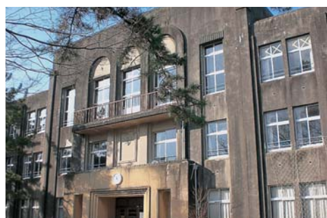
鉄筋コンクリート造3階建ての学校建築で、ヨーロッパの様式が取り入れられています。

この2件が国の登録有形文化財となり、市内の登録文化財は、旧広野家住宅の主屋、内蔵、土蔵の3件を合わせ5件となりました。 一般的に、文化財というと、寺社やお城をイメージする方が多いと思いますが、最近では明治から昭和初期の建造物にも歴史的な価値が再認識されてきています。 大阪や神戸などではこのような近代の建築物がたくさん残っており、内部を改造し、おしゃれな喫茶店やレストランなどに活用されており、今後、鳥羽市でも、このような文化財を残すだけでなく有効な活用方法を考えていく必要があります。