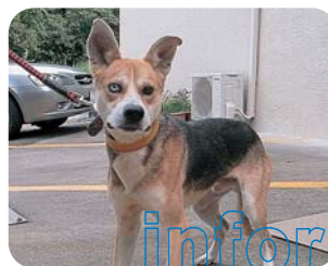
杉田ゴン(オス・2歳)