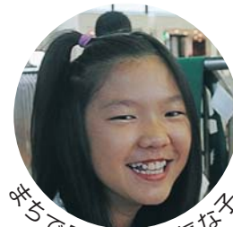
※こちらで見かけた元気な子