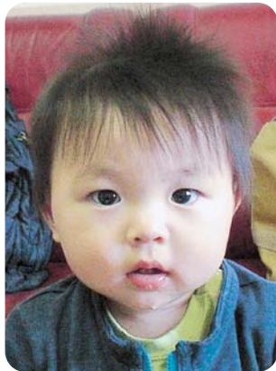
ねえねが大好きなれおです♡ いっぱい遊んでね!