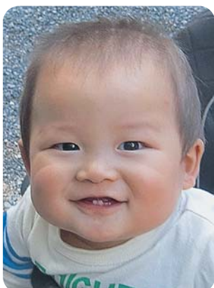
航也はくいしんぼうパンザイ♡