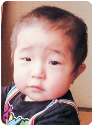
すくすく大きくなってね♡