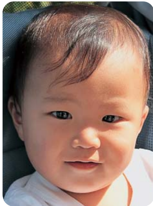
お兄ちゃん大好き! 元気にたくましく育ててね★