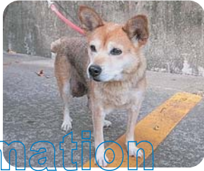
杉田パー子(メス 16歳)