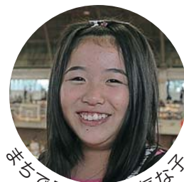
平気で見かけた元気な女