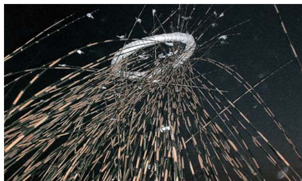
突き上げられたアワ

この祭りは大晦日の宵から 元日未明におよぶ八代神社の 祭りです。大晦日の夜にグミ の木を用い、太さ15cm、直径 2m程の輪を作り、白紙で包 み麻で巻いて日輪に擬した 「アワ」と、25cm程のモチの 木を十二角に削り、三六五の 目盛りをつけた「サバ」とい う棒が用意されます。