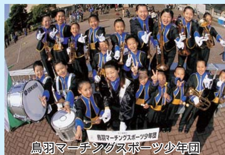
鳥羽マーチングスポーツ少年団