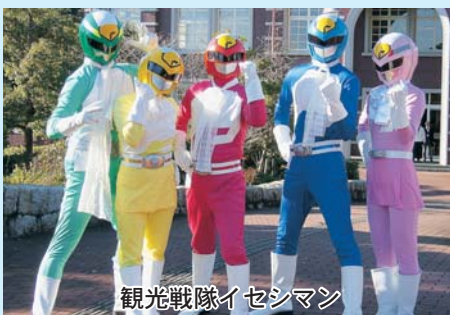
観光戦隊イセシマン

港の先端にある公園緑地では、鳥羽の特産品の販売ブースや、こどもたちを対象とした模擬店が出店されるほか、公園緑地ステージでは、地元鳥羽の「志州飛島太鼓」、「鳥羽マーチングスポーツ少年団」、「キス・キス・キッズ」によるアトラクション、そしてご当地ヒーロー「観光戦隊イセシマン」によるステージショーが行われます。