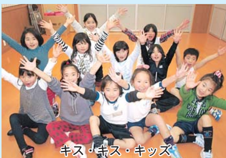
キス・キス・キッズ