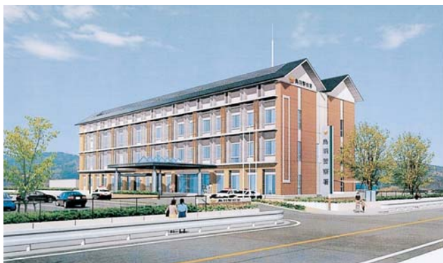
鳥羽警察署新庁舎完成予想図

鳥羽警察署につきましては、現在新築工事を行っています。今春、庁舎が完成し、業務(供用)を開始する予定をしておりますのでご連絡いたします。