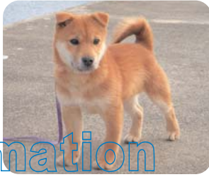
世古コロン(オス 6か月)