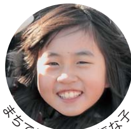
まちで見かけた元気な子