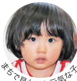
先ちで見かけた元気な

広報とばに掲載された 写真を差し上げます。 ご希望のかたは、総務 課広報情報係まで。