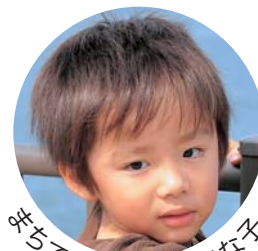
先ちで見かけた元気な子

広報とばに掲載された 写真を差し上げます。 ご希望のかたは、総務 課広報情報係まで。