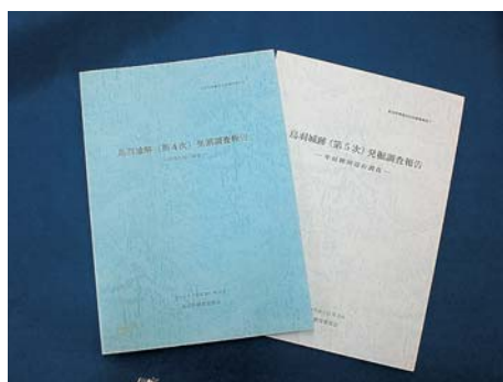
過去に発表した調査報告書

果を得ることができました。今回の調査では、整理箱で400箱にも及ぶ大量の瓦片が出土しました。鳥羽城は明治4年に取り壊されたために、瓦の残りは悪いのですが、文様の入った瓦も確認されています。