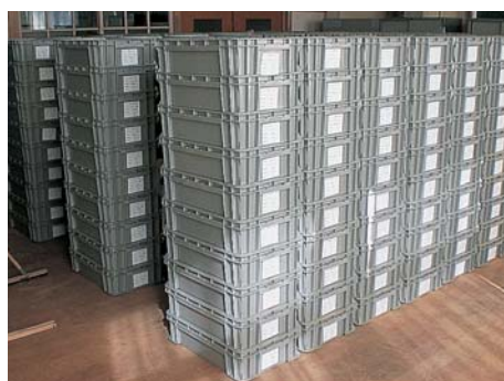
約 400 箱におよぶ整理箱

果を得ることができました。今回の調査では、整理箱で400箱にも及ぶ大量の瓦片が出土しました。鳥羽城は明治4年に取り壊されたために、瓦の残りは悪いのですが、文様の入った瓦も確認されています。