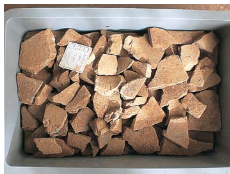
発見された大量の瓦片

前号で鳥羽城の本丸跡（旧鳥羽小学校運動場）の発掘調査成果について報告させていただきました。調査面積が少ないにも関わらず、多くの成