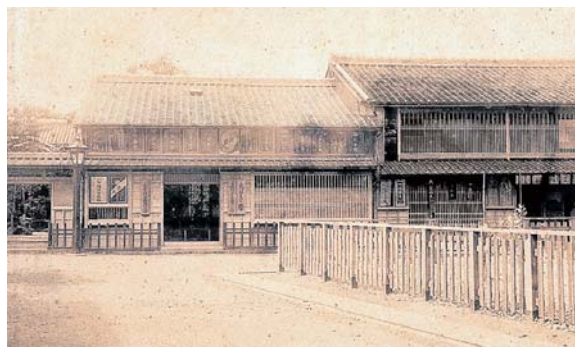
旧広野家住宅の復元イメージ

内部は、江戸時代に建てられた古い主屋については昭和初期に増築された不要なものは撤去し、昔の図などを参考に復元します。明治期に建てられた主屋については、現況を