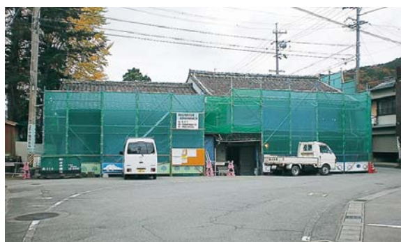
現在行われている修理工事の様子