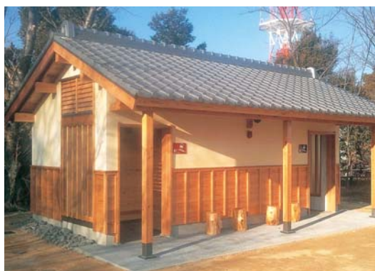
完成した城山公園のトイレ