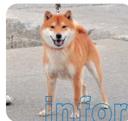
上村レオ(オス・2歳)